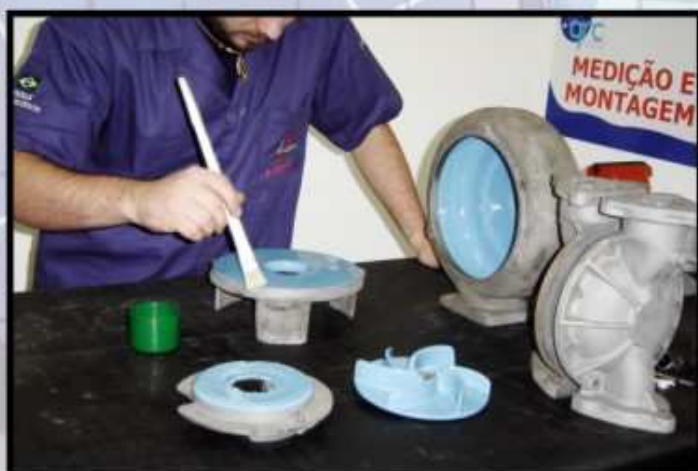
pintura especial com polímeros