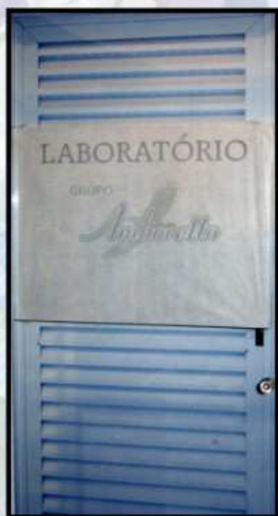
laboratório de medição