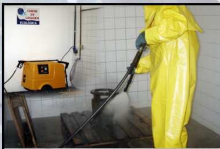
lavagem cabine ecológica