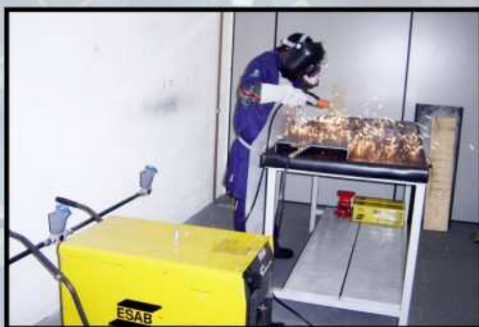
soldagem industrial mig mag