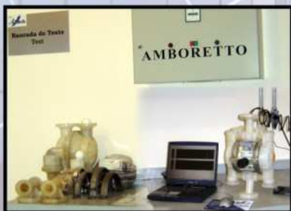
bancada de teste hidrostática e performance