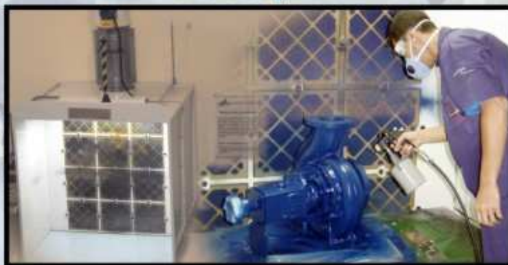
cabine de pintura