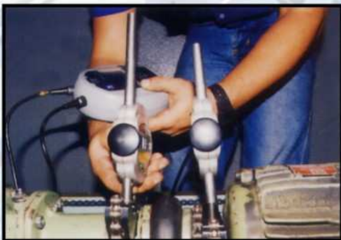
alinhamento a laser