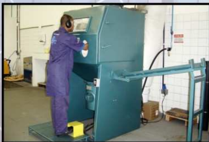
jateamento com granalha de aço ou esfera de vidro